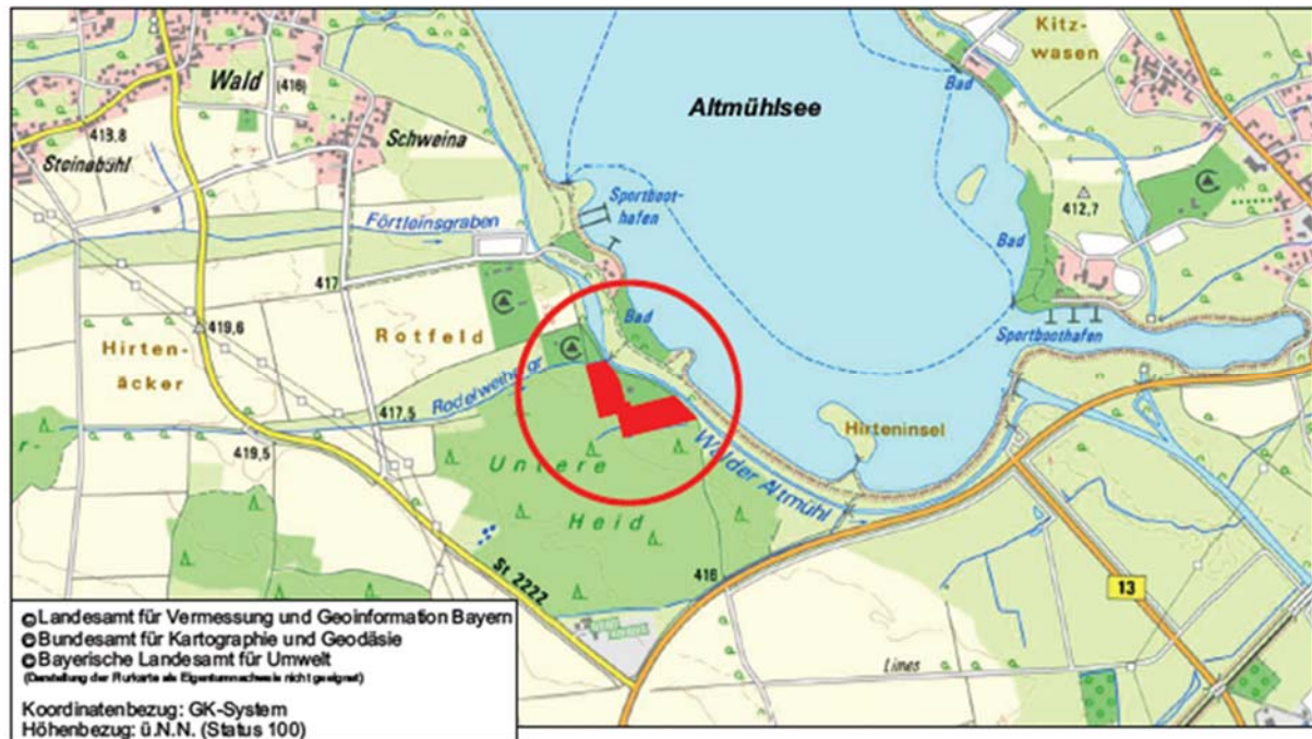
Übersichtslageplan zum Ort der 34. Flächennutzungsplanänderung

Der Geltungsbereich umfasst die Grundstücke mit den Flurstücksnummern zum Zeitpunkt der Aufstellung des Bebauungsplans: